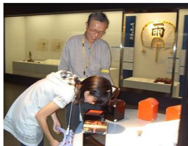
にょいの玉手箱 岐阜のにょいだよ。