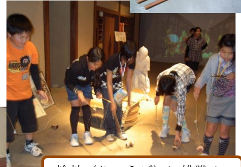
輪鼓（りゅうご）に挑戦！