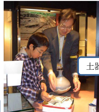
土器を組み立てよう！