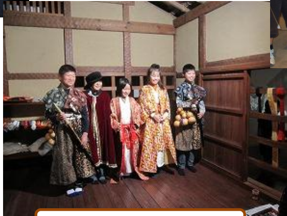
戦国時代の衣装を着よう！