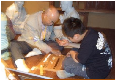
盤双六（ばんすごろく）