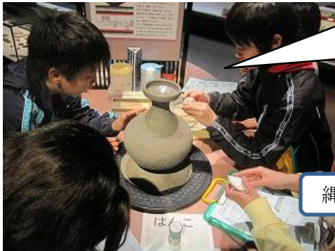
縄文土器の文様をつけてみよう

岐阜市歴史博物館の総合展示室では、さまざまな体験をとおりて歴史を学ぶことができます。小学校6年生や中学生向けのワークシートの他に、低中学年用クイズもあり、体験だけでなく、展示コーナーも各学年に合わせて理解して見ていただくことができます。