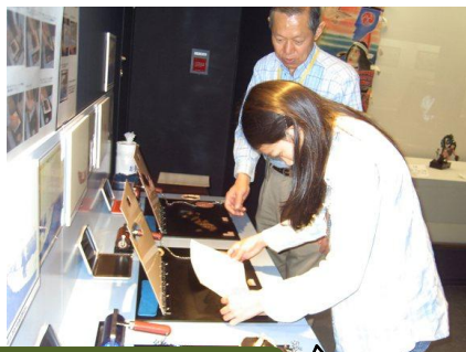
浮世絵の重ねずり