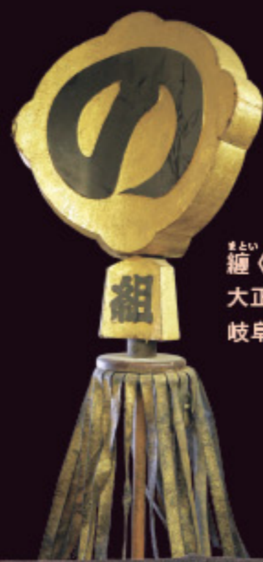
繻(野一色・の組)(部分) 大正~昭和戦前 岐阜市立長森北小学校蔵