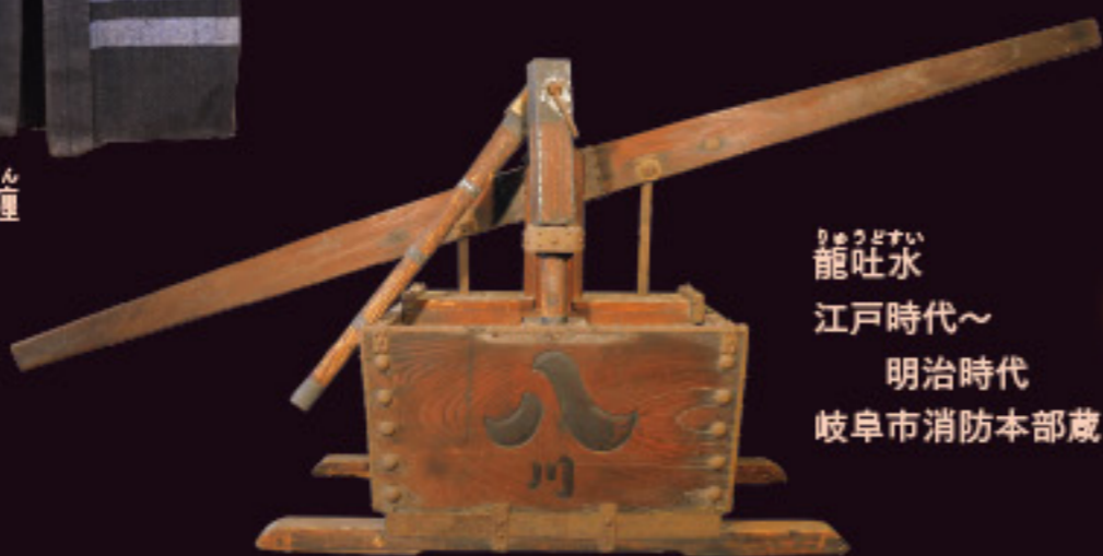
龍吐水 江戸時代~ 明治時代 岐阜市消防本部蔵