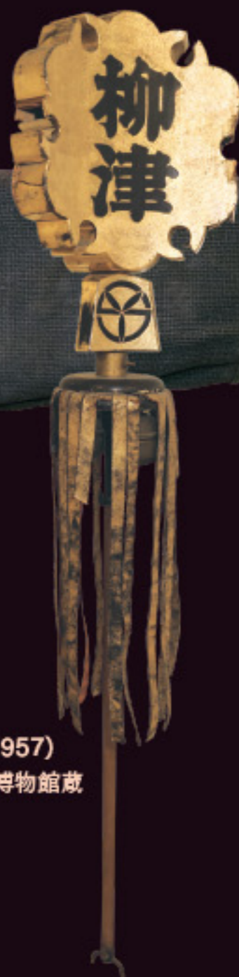
繻(柳津) 昭和32年(1957) 岐阜市歴史博物館蔵