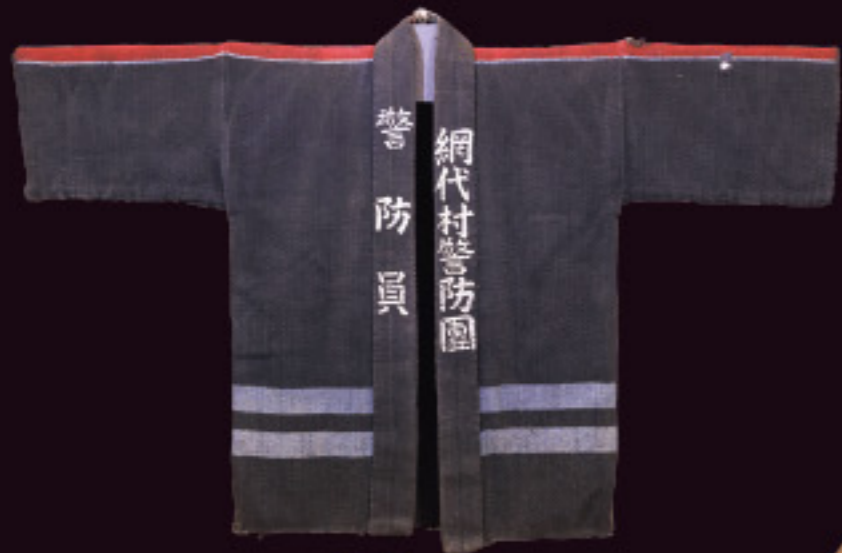
網代村警防團刺し子半纏 昭和14~22年 岐阜市消防本部蔵