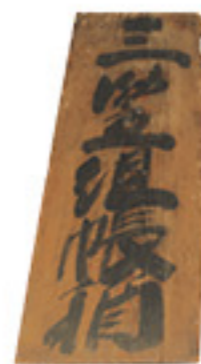
みたまぐさ 三笠組関係資料 江戸時代 個人蔵