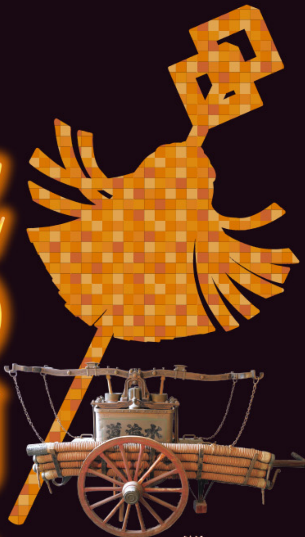
腕用ポンプ 大正13年(1924) 岐阜市消防本部蔵