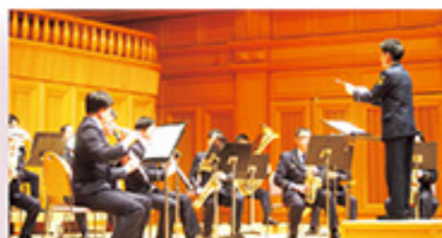
消防音楽隊によるコンサート風景