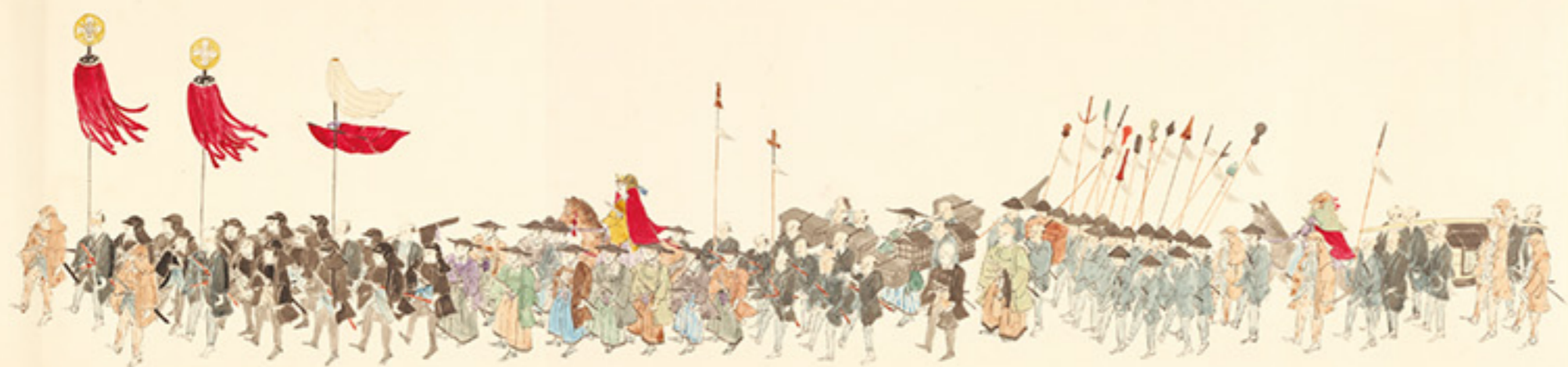
加納藩主永井家行列図巻(部分) 明治時代 八幡実秋 画 岐阜市歴史博物館蔵 展示期間: 8月27日(火)～9月16日(月・祝)

火災などから、私たちの命や暮らしを守る「消防」。その歴史は、遠く江戸時代にまでさかのぼります。「火事と喧嘩は江戸の華」という言葉があるように、当時の江戸での火消の活躍は有名ですが、そのころの岐阜でも火消たちの存在はなくてはならないものでした。その後、近代の消防組・警防団などの組織を経て、戦後に「自治体消防」と呼ばれる現代の消防体制が整備されていきます。本展では、岐阜市やその周辺に残る江戸時代以降の消防用具や歴史資料を一堂に集め、岐阜の消防の歴史を紐解きます。